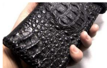
央媒：查处金融大鳄和内鬼，重点环节是查办职务犯罪案件