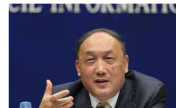
自然科学基金委回应107篇撤稿：撤销40多项已资助项目