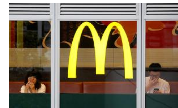
麦当劳明年开始全球逐步停用抗生素鸡，中国不在第一批名单

《暂行规定》首次对专区“双录”管理作出比较系统性的规范，主要有以下几方面的新要求： 一是进一步明确了适用的产品范围。 《暂行规定》第二条规定，银行业金融机构代销国债及实物贵金属，可根据实际情况自行决定是否纳入专区“双录”管理。除此之外的理财及代销产品，均应实施专区“双录”管理。 二是对自助购买作出规范。 《暂行规定》第十一条对自助购买过程中的销售人员代客操作、介入营销等事项作出限制。 三是要求机构设计统一