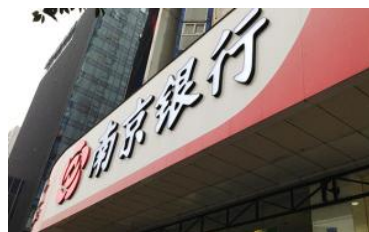
南京银行上半年净利增17%，股票获证金公司增持逼近举牌线