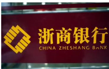
浙商银行上半年净利润56亿元增长18.56%，不良双升