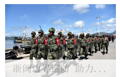
浙闽边界巡防助力...