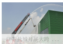
江苏盐城开展大跨...