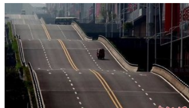
重庆现“波浪形”公路：为减少安全隐患将长下坡修成阶梯状