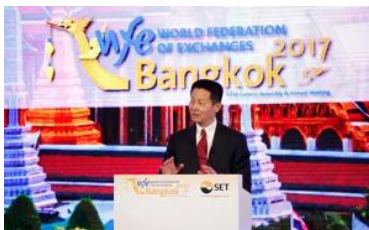
上海证券交易所理事长吴清当选世界交易所联合会主席