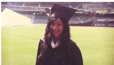
华裔女生谈童年抵美者暂缓遣返计划被废：噩梦成真，前途未卜