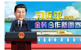
条漫 | 习近平绘就金砖合作新画卷