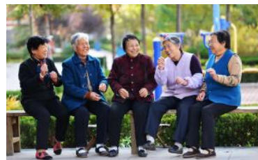
基金业协会养老金专业委员会成立：做好养老金投资管理主力军