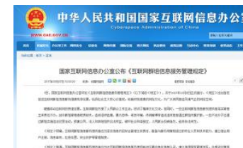
国家网信办：互联网群组建立者、管理者应当履行群组管理责任