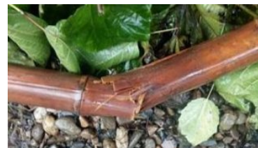
过路收割机损坏陕西村民一根竹竿，被困13小时赔200元