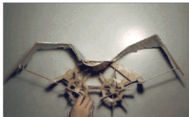
Z博士的脑洞 | 这是旧周期向新周期转换的开端，改革并未完成