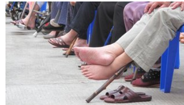
IMF：中日韩泰迅速步入老龄化社会，或致年GDP降1%