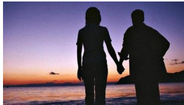
15万个流动人口家庭调查：流动的家庭婚姻稳定吗