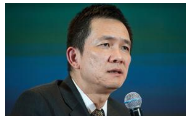
北大国发院院长姚洋：经济去杠杆，出路在于提高消费降低储蓄