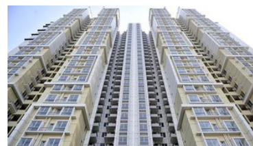
广东佛山一男子出国三年回家，发现邻居将其房子装修出租