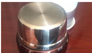
七夕女子快递给丈夫的爱心汤现异味，快递员承认偷喝后还加尿