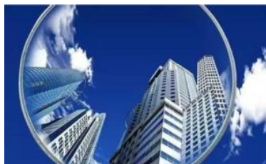
央媒解读广州“租购同权”新政：房屋租赁时代或到来