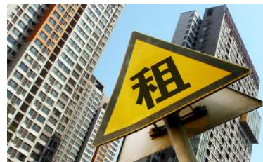
深圳规土委：创新解决城中村历史遗留问题，盘活存量租赁资源