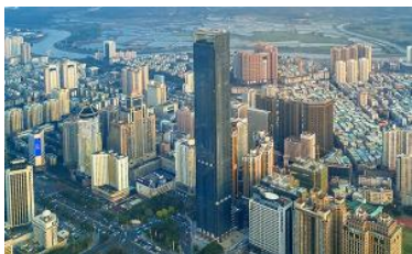
深圳市房屋租赁公司已正式挂牌，系市属国有住房租赁专营企业