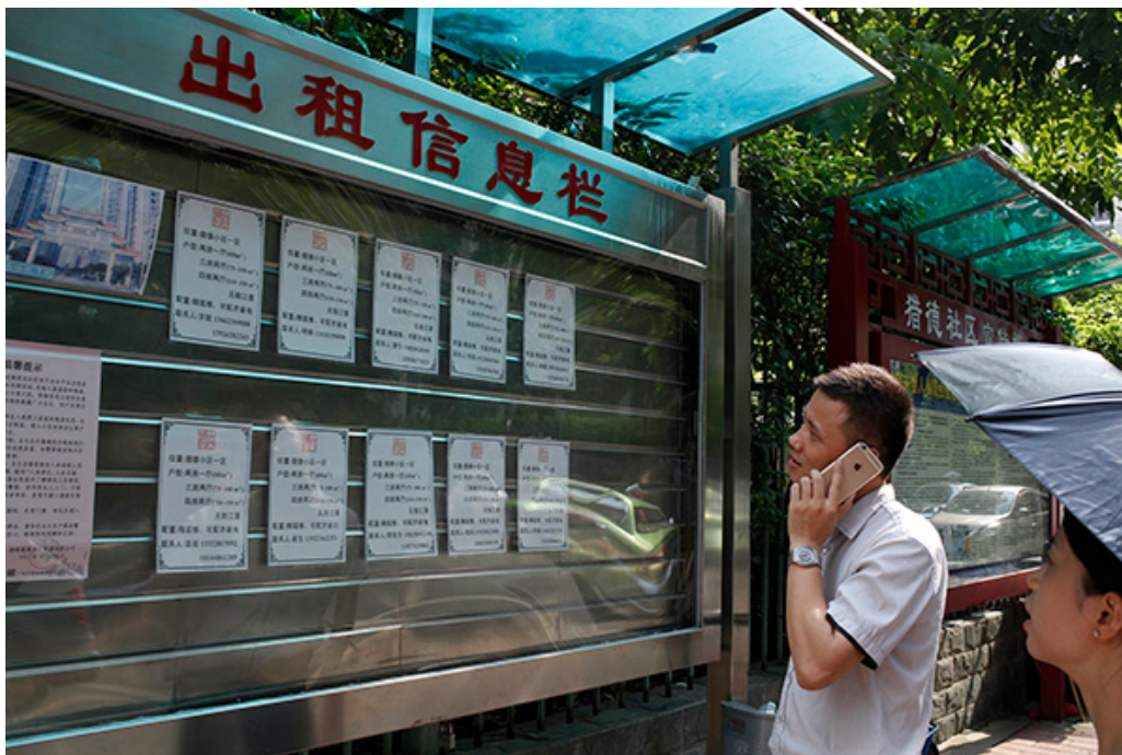
7月17日，广州市发布“租赁16条”。

广州日报9月17日消息，近日，广州市住房与城乡建设委发布《广州市房屋租赁网上备案规则（征求意见稿）》（简称《意见》），公开征求意见。今后租赁双方自行签订房屋租赁合同，出租人需要实名办理网上备案手续，出租人和承租人双方还需在广州市房屋租赁政府信息服务平台实名认证。