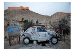
旧甲壳虫车打造成展馆