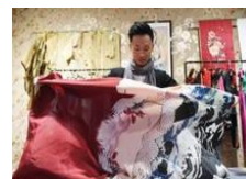
85后小伙缝出旗袍风韵