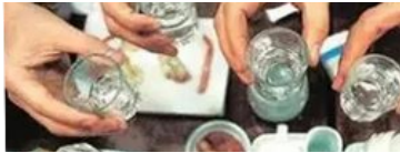
男子酒后死亡家属索赔 法院：同饮者不担责

不忍母亲被打 四川大学生刺死邻居逃亡16年 金店老板凌晨遭劫杀 嫌犯潜逃整容时被抓 新年心慌慌 俄罗斯50城再遭“炸弹”惊魂 不满苹果公司赔偿方案，韩十余万人集体诉讼