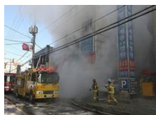
韩医院火灾数十人死伤