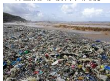
风暴过后海滩成垃圾场