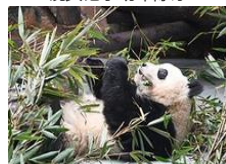
成都回应“虐待大熊猫”