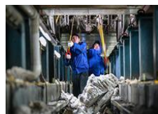
镜头记录动车除冰