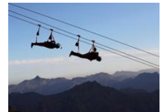
世界最长高空滑索开放