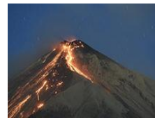
火山喷发熔岩成火河