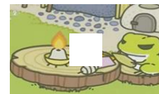
日本手游刷遍朋友圈 记者探访《旅行青蛙》制作公司