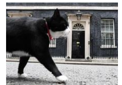
英外交部捕鼠官被制裁