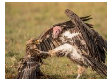
秃鹫与鹰上演夺食大战