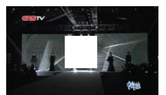
亚洲超模军团闪耀时尚周