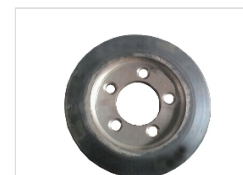
聚氨酯轮 亚而抽半