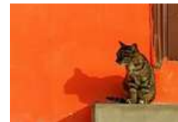
即将截稿：今年不可错过的摄影赛