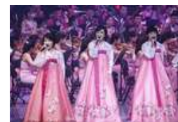
朝鲜艺术团韩国演出门票遭疯抢