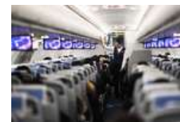
“90后”乘务长的春运“首秀”