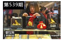
第539期 狗年收藏品市场火爆，新年都能收藏啥？