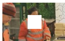
包子铺免费提供食物给环卫工