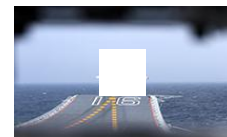
海军罕见训练画面曝光