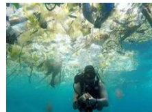
巴厘岛海洋垃圾成灾