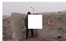
景区厕所用雪搭成

七是明确了行政公益诉讼的裁判方式。司法实践中，人民检察院提起公益诉讼后，大多数行政机关都会采取措施、履行法定职责，从而使人民检察院的诉讼请求得以实现。《解释》规定，人民检察院撤回起诉的，人民法院应当裁定准许；人民检察院变更诉讼请求，请求确认原行政行为违法的，人民法院应当判决确认违法。同时，《解释》还以列举的方式规定了行政公益诉讼案件的裁判方式。