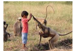
孩童与猴群一起玩耍