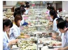
实拍公交点钞“娘子军”