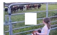
女孩拉手风琴 牛群跑来捧场