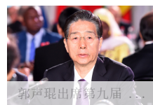
郭声琨出席第九届