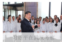
习近平在武汉考察