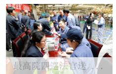
最高法院四巡法官送