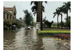
厦门暴雨厦大校园被淹