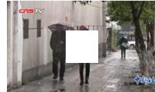
乌鲁木齐遭遇强雨雪天气 气温大幅下降