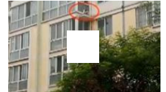
“熊孩子”贪玩跌出六楼 窗户