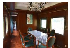
南京观绿皮火车酒店