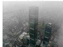
湖南第一高楼建成